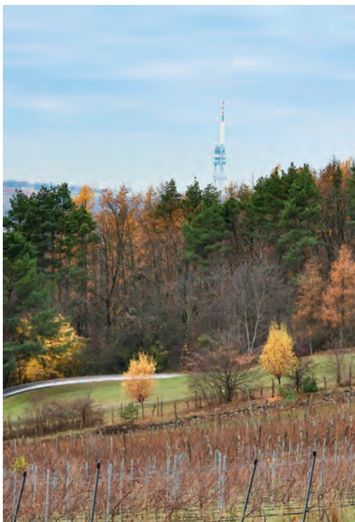
Pod Prosekem – Praha – výhled na Petřinskou věž