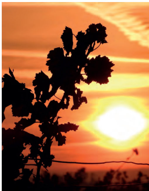
Svítání v podzimní vinici