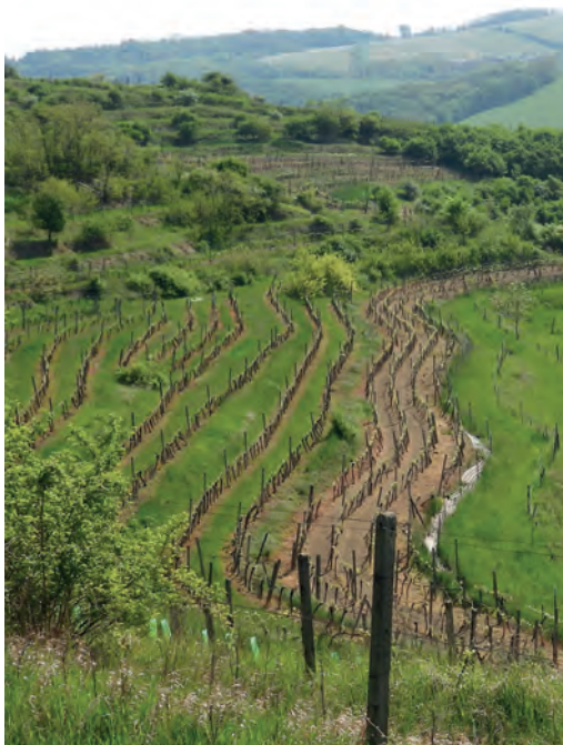
Lísky – Hustopeče