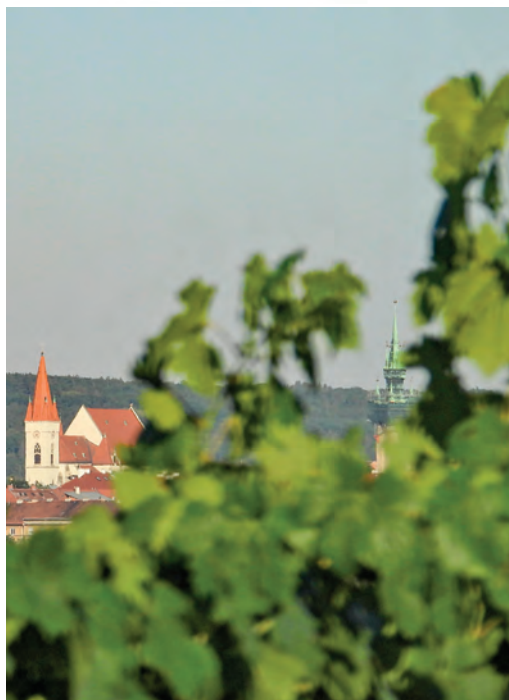
Výhled na Znojmo z Dobšic