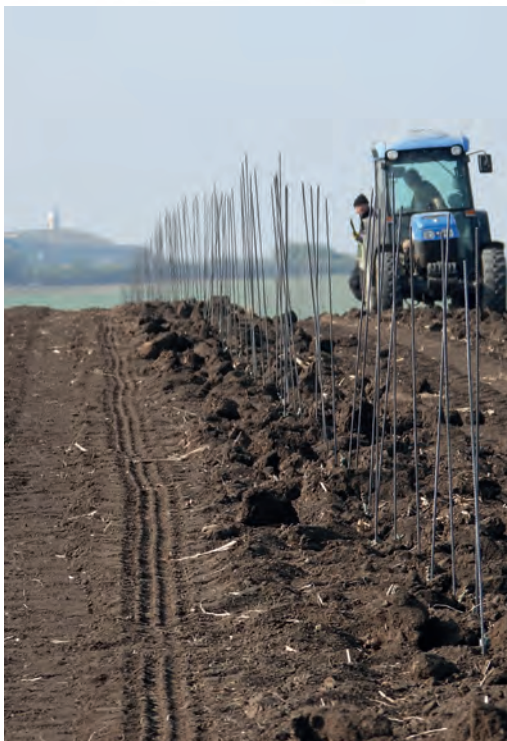
Výsadba vinice na Vrbici – výhled na kapličku ve velkých Bilovících