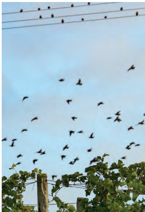
Němčičky u Hustopečí – období sklizně