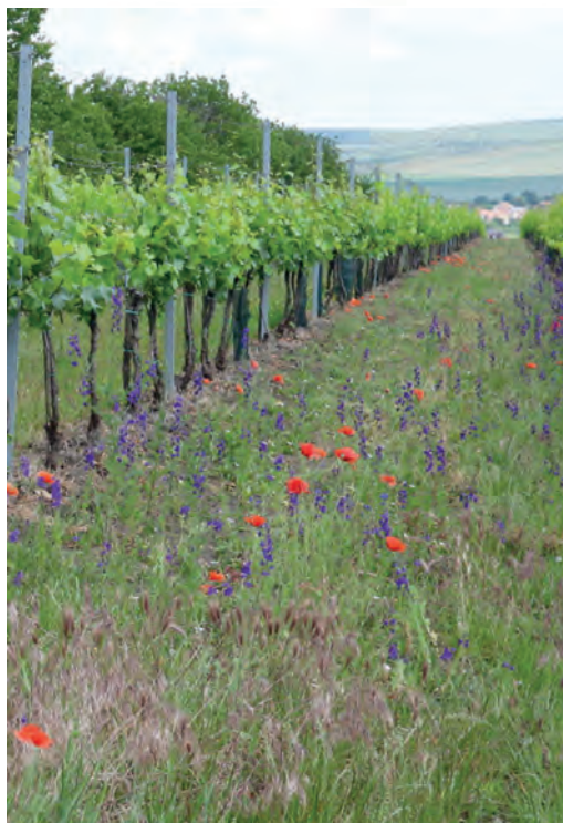
Nadzahrady – Velké Pavlovice