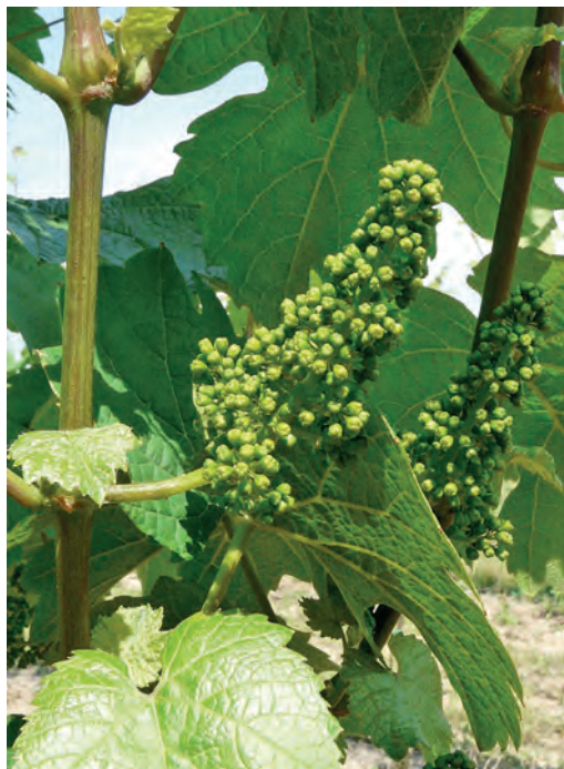
Vývoj květenství – květenství úplně vyvinuta