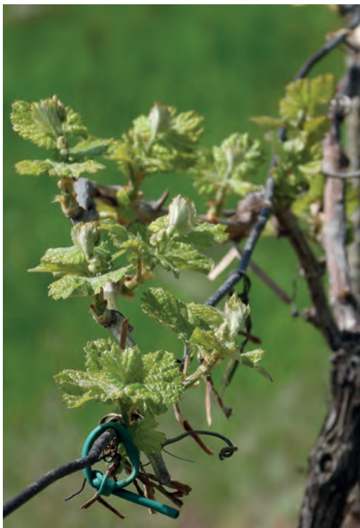
Vývoj listů – 2 rozvinuté listy