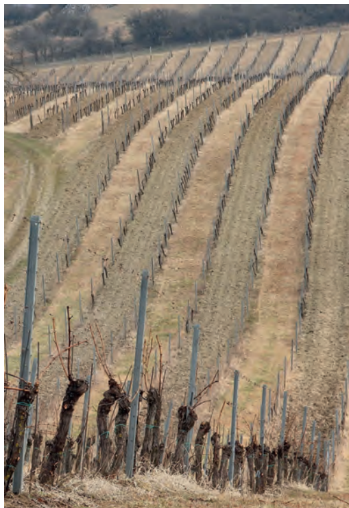
Bavorsko – Klentnice