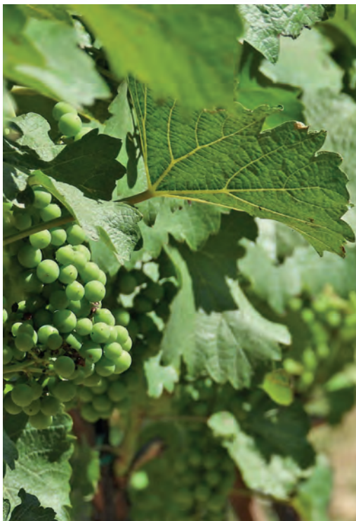
Vývoj hroznů – bobule velikosti hrachu