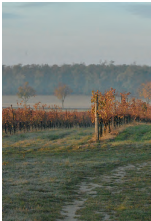
U lipky – Oleksovice