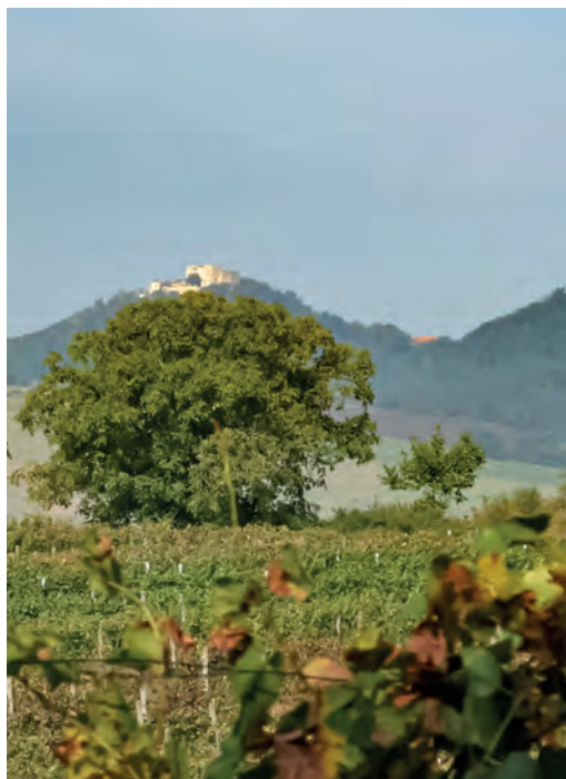
Žleby-Zlechov – výhled na Buchlovský hrad