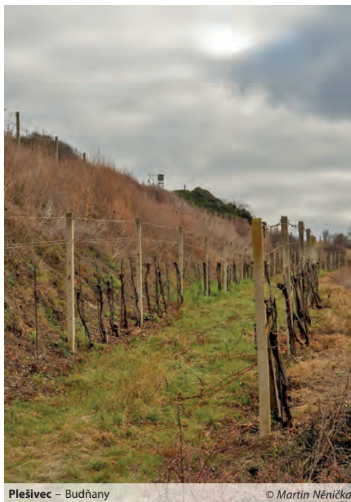
Plešivec – Budňany