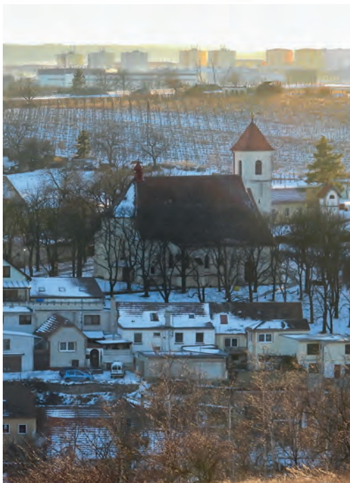
Poloudíly – Únanov