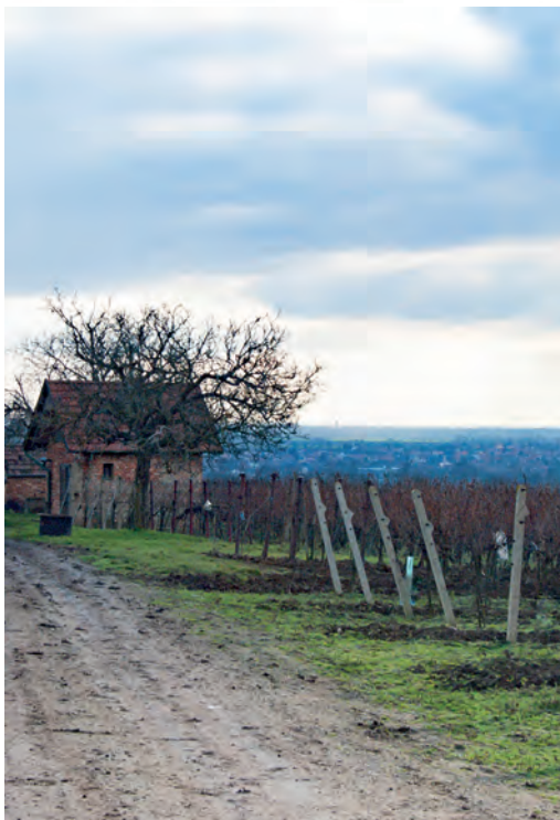
Nechory – Průšánky