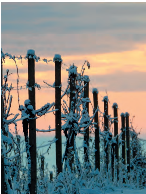
Kravi Hora – Konice

poslední den podání prohlášení o sklizni a prohlášení produkci. Pokud nebylo nic sklizeno nebo vyrobeno, podává se prohlášení s hodnotou nula. / ÚKZÚZ