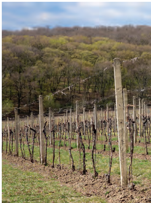
Ochoze – Vrbice