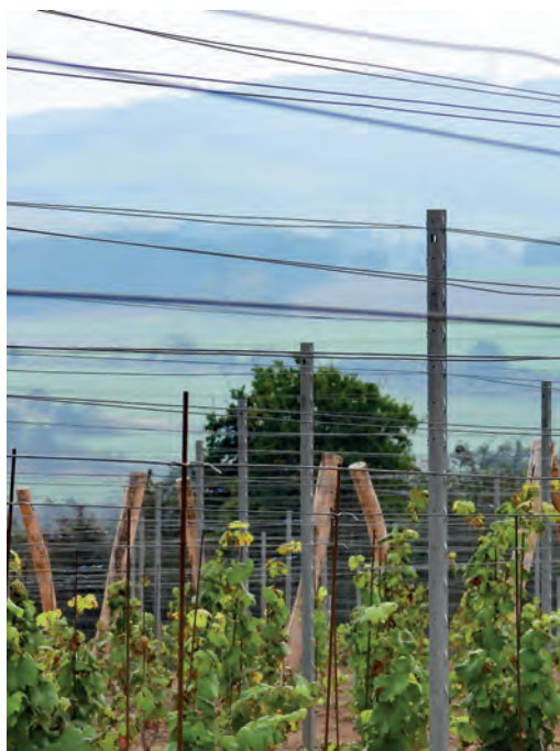
Radič na Příbramsku – na horizontu rozhledna Drahoušek

poslední den podání prohlášení o zásobách vinařských produktů k 31. 7. 2023. Pokud nejsou žádné zásoby, podává se prohlášení s hodnotou nula. / UKZÚZ