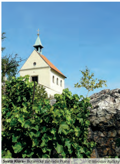
Svatá Klára – Botanická zahrada Praha