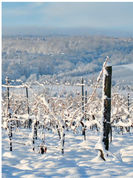
Fládnická – Hnanice