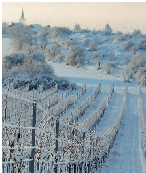
Skalky – Šatov